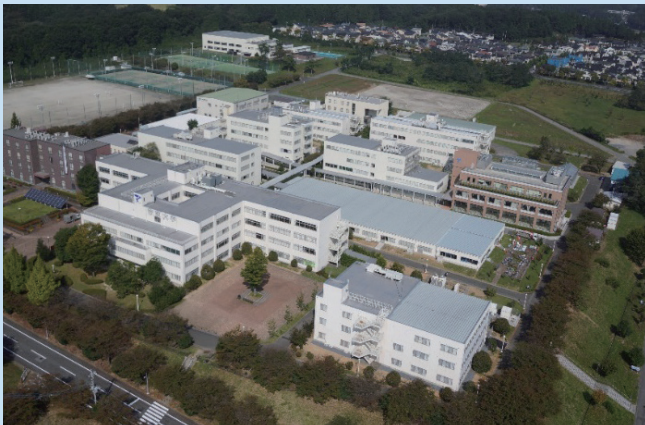
帝京大学宇都宮キャンパス