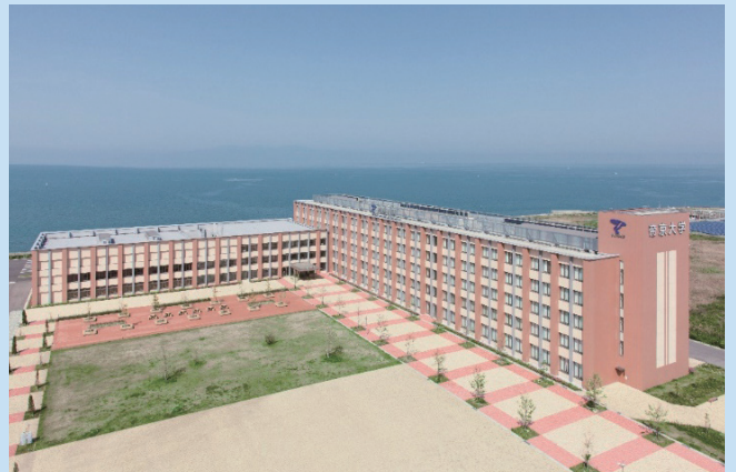
帝京大学福岡キャンパス