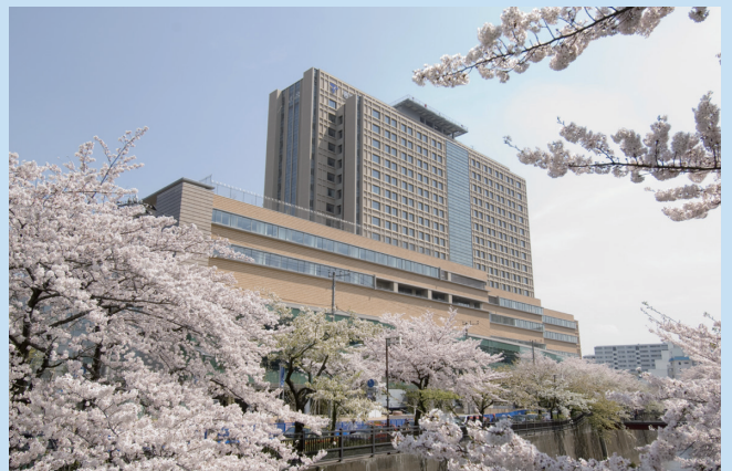
帝京大学医学部附属病院