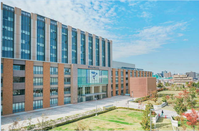
帝京大学板橋キャンパス

帝京グループの主要キャンパス、附属病院、初等中等教育施設等を中心に、設計及び施工等の総合調整を行っています。