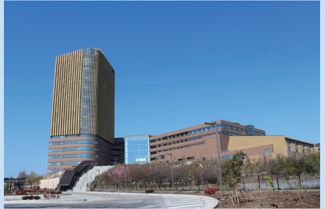
帝京大学八王子キャンパス