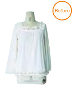
Remake 1 袖を切り、長さを変えて再度縫い合わせる。フリルのボリューム感がかわいい半袖シャツに。他の古着で作ったコサージュもポイント。「半袖になるなんてびっくり。フワフワでかわいいです」 坂井美穂さん Miho Sakai 文学部社会学科2年