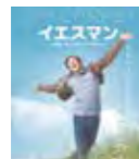
▲「イエスマン“YES”は人生のパスワード 特別版」(ワーナー・ホームビデオ ¥1,500)