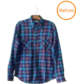
Remake 2 シャツの裾を切り、コーデロイの古着を縫い合わせて、ジャケットが完成。襟に使われたネクタイのチェックがオシャレ。「おもしろいです。ネクタイを使うなんて、僕じゃ思いつかないですね」 青木智仁さん Tomohito Aoki 文学部社会学科3年