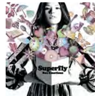
▲「Box Emotions」Superfly (WARNER MUSIC JAPAN ¥3,150)

2009年9月に発売されたSuperflyの2ndアルバム。ドラマや映画主題歌など話題の楽曲が満載の充実作。オリコン・ウィークリーチャート首位を獲得。