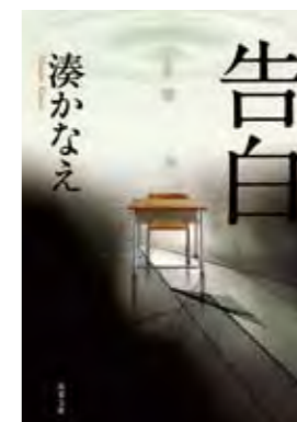
▲「告白」湊かなえ (双葉社 ¥650)

衝撃的なラストを巡り物議を醸した、著者渾身のデビュー作。2008年週刊文春ミステリーベスト10第1位、第6回本屋大賞を受賞。