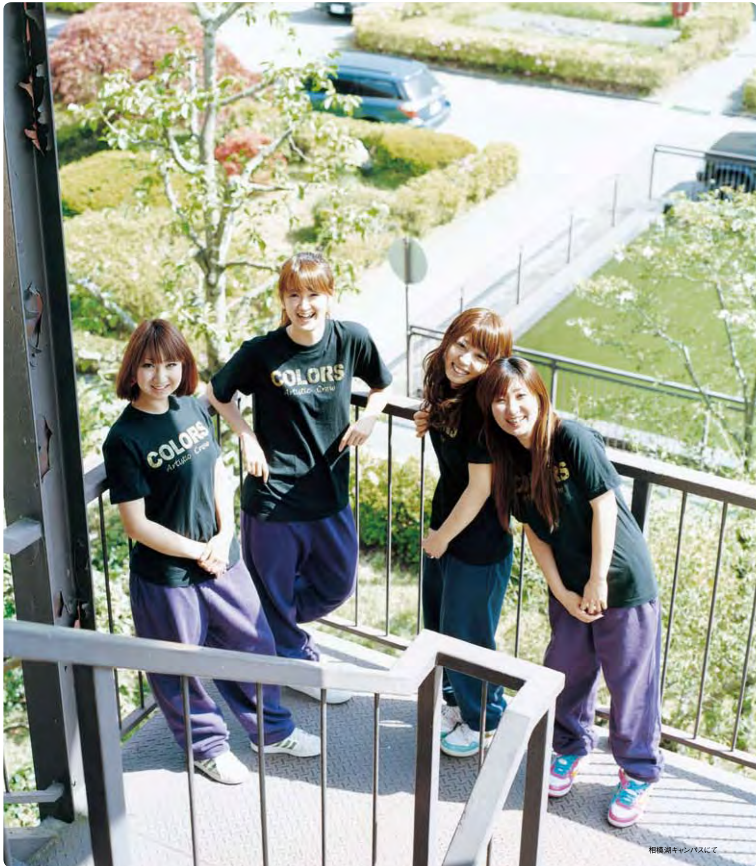
相模湖キャンパスにて