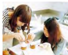
カップケーキにトッピング。おしゃべりをしながらでも、みんな表情は真剣だ。