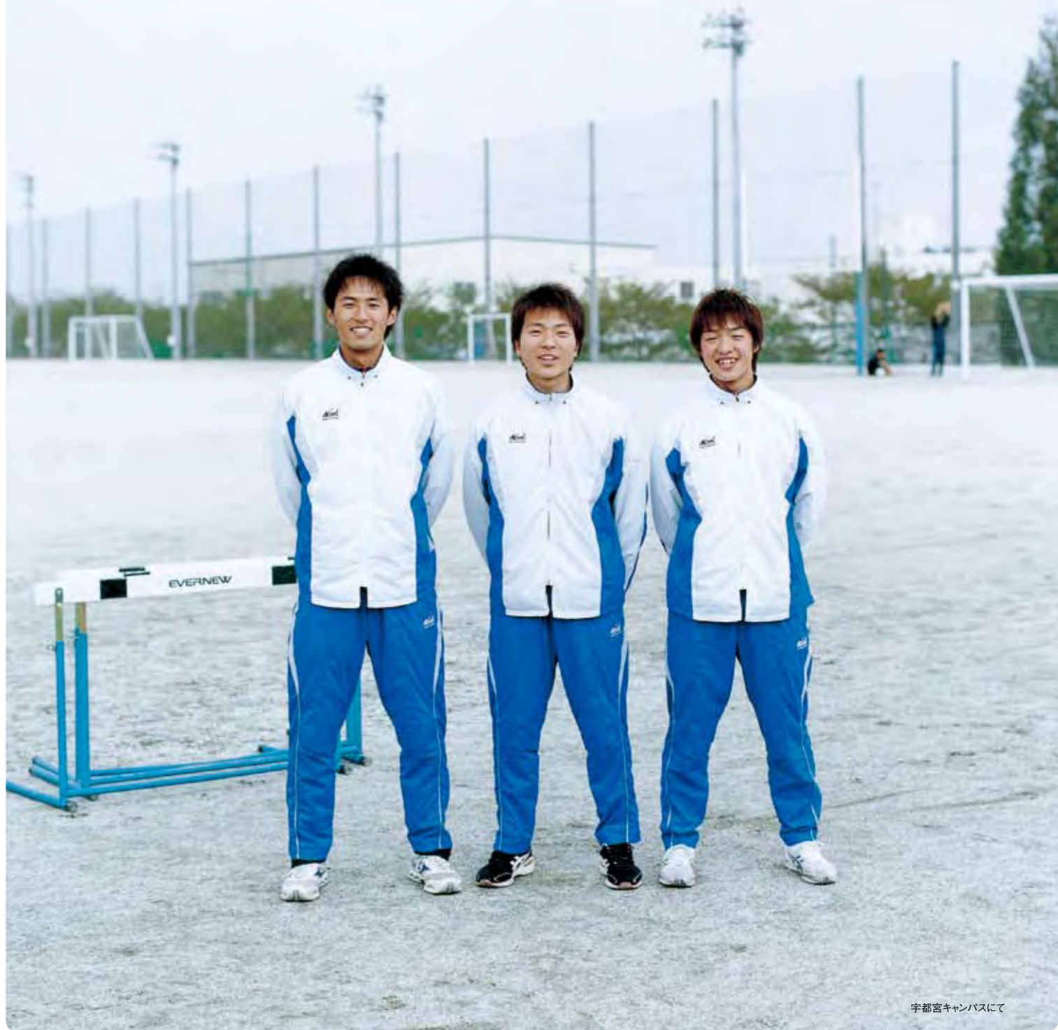
宇都宮キャンパスにて